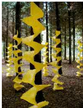
Fiction - Belfort – 2007