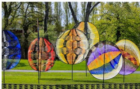
Jardin des Arts – Chateaubourg - 2012