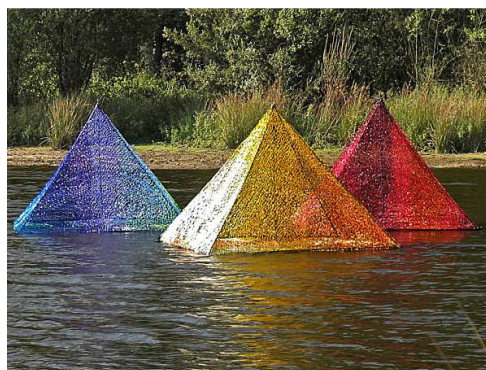
Entretemps – Seiche - 2009