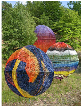
Prélude – Forêt d'Halatte - 2001