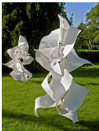
Sarambade - Lyon - 2007/08