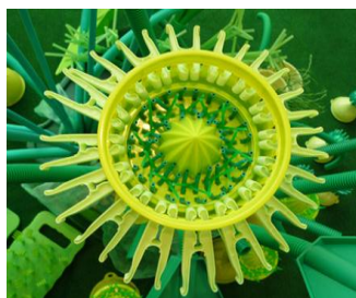
2014 : CHRISTOPHE DALECKI