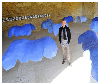
2012 : BAP