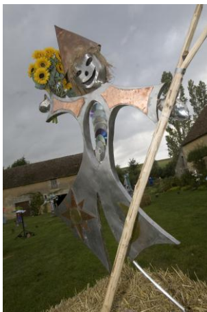
2008 : ÉPOUVANTAILS, ÉPREUVES D'ARTISTES