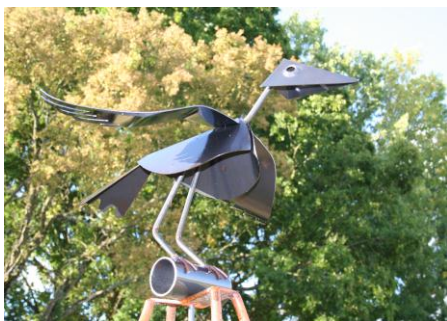
2009 : EMMANUEL ET FABRICE PERRIN