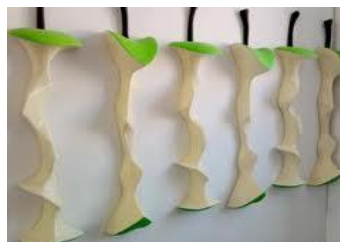
2015 : JULIEN GUDÉA – GÉRARD BATALLA