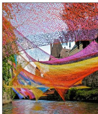
2013 : ÉDITH MEUSNIER