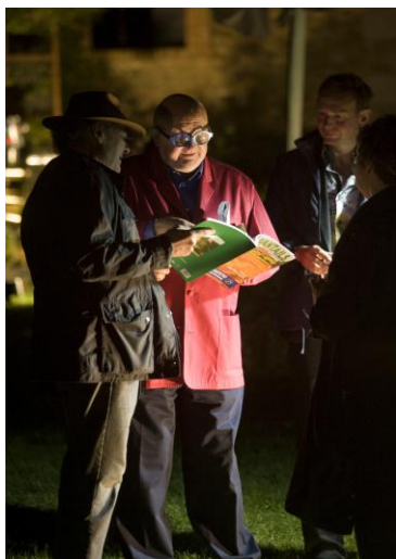
2008 : ÉPOUVANTAILS, ÉPREUVES D'ARTISTES